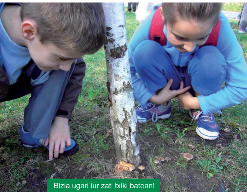
Bizia ugari lur zati txiki batean!

• LH-ko 1 eta 2. mailakoak herriko parkeetara atera dira ingurunea ezagutzera.