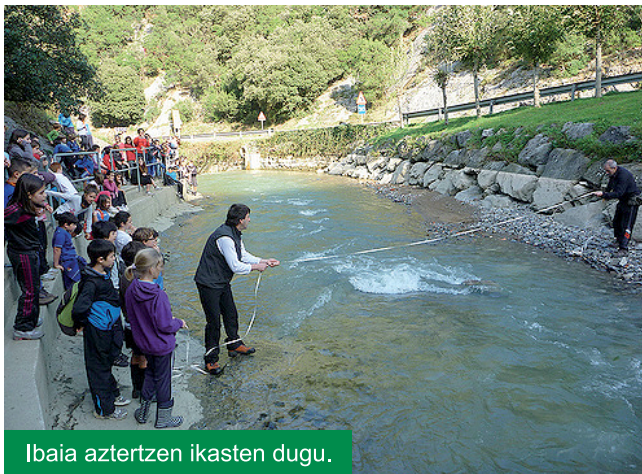
Ibaia aztertzen ikasten dugu.

• LH-ko 3. eta 4. mailakoek habitat desberdinak ezagutu dituzte, hauen egoera aztertu, eta naturak eskaintzen dizkigun ondasun eta zerbitzuak baloratzen ikasi dute; natura irudi polit bat baino gehiago da eta!!