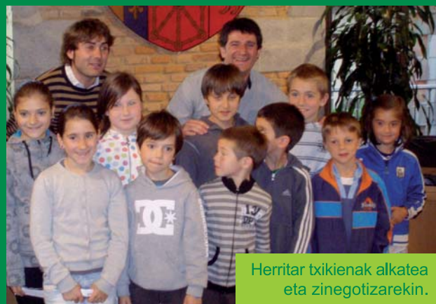
Herritar txikiak alkatea eta zinegotzarekin.

Ordezkariak gogoz entzun zituzten ikasleen ekarpenak eta orain beraien txanda da, proposamen hauei erantzuna emanez.