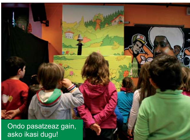
Ondo pasatzeaz gain, asko ikasi dugu!

Gabonak eta kontsumoak: Txotxongilo saio honetako aurtengo pertsonaia Sigismundo izan zen, eta Tolosaldean zehar bidaiatzen ari zela, bertako biodibertsitatea landu genuen: animaliak, landareak eta paisaia. Honetaz gain, bertako kultura, hizkuntza eta bizi-modua ere landu ziren, alderdi horiek zaintzearen garrantzia azpimarratuz. Aurten bi tailer burutu dira: usain tailerra eta txotxongiloen eskulan tailerra.