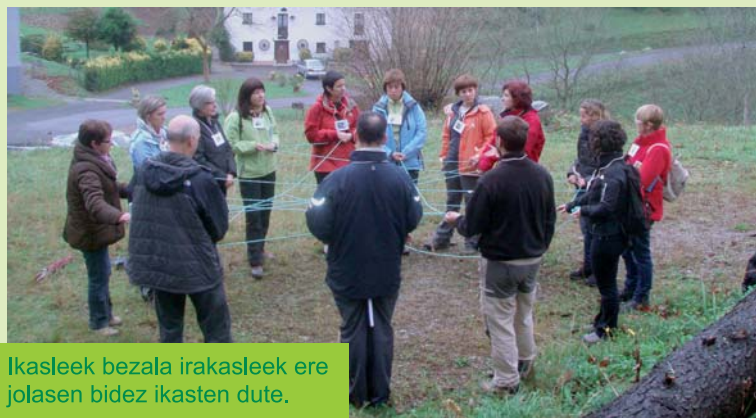
Ikasleek bezala irakasleek ere jolasen bidez ikasten dute.

Irakasleen lana eta inplikazioa oso garrantzitsuak dira EA21 proiektua aurrera jarraitu ahal izateko. Irakasleen ordezkariak gela barruko eguneroko lana egiteaz gain, koordinazio bilerak, prestakuntza saioak eta eskola komunitatearen inplikazioa lortzen lan handia egiten dute, eskerrik asko guztiei!