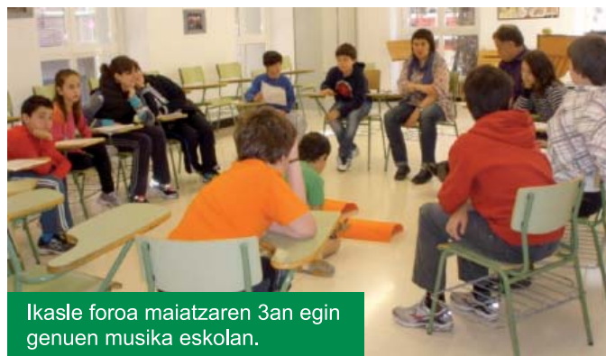
Ikasle foroa maiatzaren 3an egin genuen musika eskolan.

tsitatearen egoera hobetzeko hartu dituzten konpromisoak eta udal gobernari aurkeztutako proposamen garrantzitsuenak aukeratu ziren.