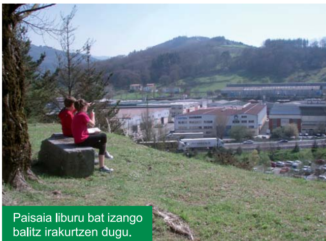
Paisaia liburu bat izango balitz irakurtzen dugu.

• LH-ko 5. eta .6 mailakoek paisaia "irakurtzen" ikasi dute eta aniztasunaren garrantzia aztertu dute, herritarrei galderak eginez.