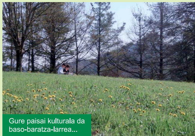
Gure paisai kulturala da baso-baratza-larrea...