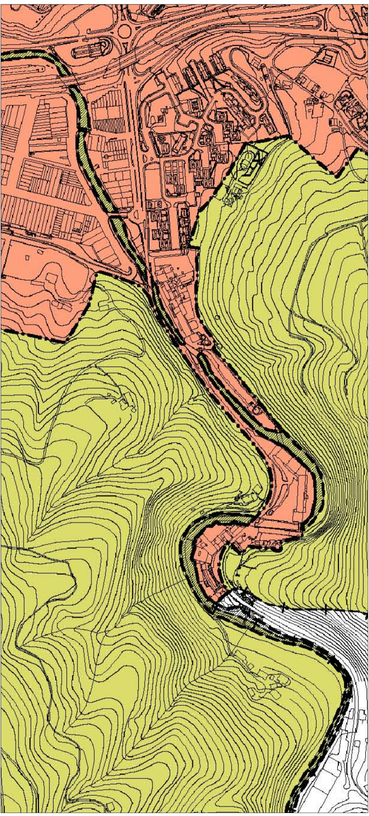
36. AREA DE INTERÉS NATURALÍSTICO RIO ARAXES